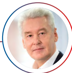
Сергей Собянин Мэр Москвы

Пригородные электрички во всем мире становятся частью метрополитена. Мы ставим себе такую же задачу. Предстоит сделать сквозные диаметры, чтобы люди, не останавливаясь на вокзалах, могли проезжать, как на метро, через весь город транзитом, при этом с такой же скоростью, с такой же частотой, с таким же комфортом, пользуясь единым билетом на метро и электричку.